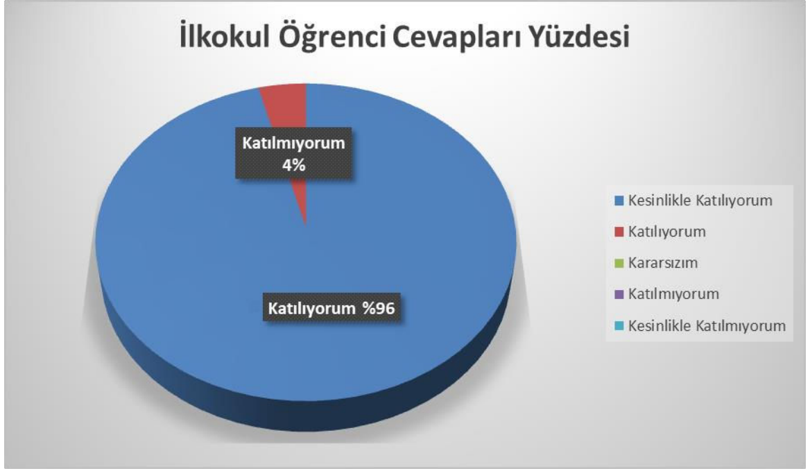
Şekil 1. Okulumu seviyorum.