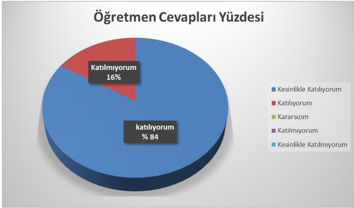
Şekil 1: Okul personeli arasında dostane bir ilişki sürdürülür.